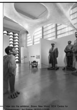
View into the exhibition Brave New World, DOX Centre for Contemporary Art Prague, 19/2016-2018