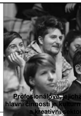
Profesionálové, jejichž hlavní činností je kulturní a kreativní sektor