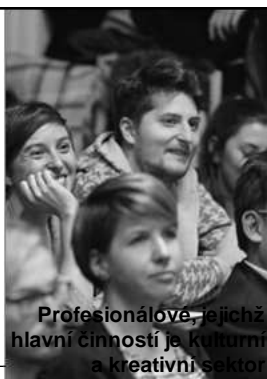
Profesionálové, jejichž hlavní činností je kulturní a kreativní sektor